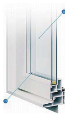
YKKAP 社 APW330

屋根の二重化構造、ハリケーンタイなどの補強金物類、壁や天井のブロッキング材など、完成してから目にすることができない建物の強度や快適性に寄与する内部構造を直接見ることができます。