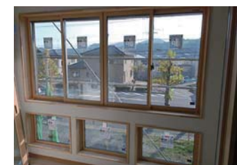
ウィンターガーデン

ウィンターガーデンは、壁・天井・床に断熱材と断熱サッシを施工したインナーテラス。冬には日射を取り込んで暖房を助け、夏や寒い時期には内側の断熱サッシを閉めると、室内へ暑さ・寒さが侵入しにくくなります。花粉や梅雨の時期、夜の洗濯物干場としても役立つ、機能的な空間です。