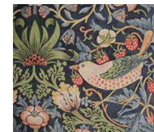
パキスタン製の ウィリアム・モリス 手織りのテントバンド 「いちご泥棒」