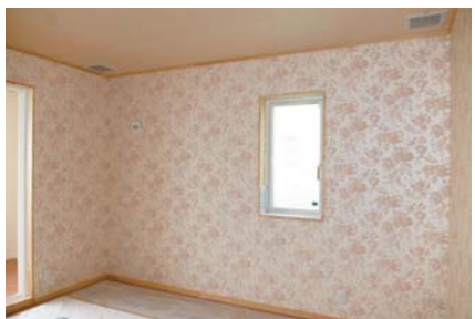
家全体を淡いトーンに統一しながら、部屋ごとに雰囲気を変えた内装のコーディネート