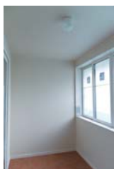
奥行1.8mのウインターガーデン