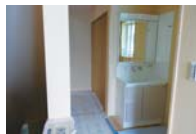
2階の廊下にも洗面台を設置