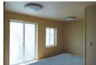
LDKの大きな掃きだし窓には両面樹脂サッシ真空トリプルガラスを採用