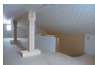
階段で上がれる小屋裏収納