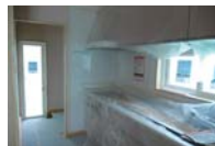
壁付けシステムキッチンから、勝手口まで2mの家事動線