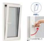
気密性が高く、二方向に開くツアクション窓