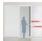
気密性が高く開閉が軽い大開口スライディング窓