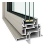
YKKAP 社 APW430

国内最高レベルの断熱性能を持つ、両面樹脂サッシ+トリプルガラスのAPW430を全面採用。気密性の高いツアクション窓と、大開口でありながら開け閉めが軽い大開口スライディング窓を採用し、断熱・気密性能をさらに向上させました。